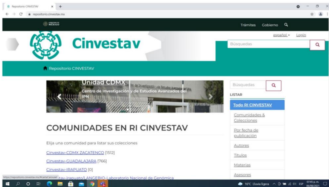
Figura 1: Pantalla de la liga https://repositorio.cinvestav.mx/

A continuación se incluye la pantalla de esta liga (Figura 1).